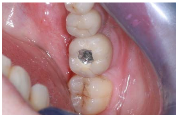
Cementuoto vainikėlio nuėmimas